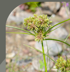
SOUCHE ROBUSTE Cyperus eragrostis

Alysson blanc Amarante hybride Bident feuillé Buddleia de David Brome purgatif Euphorbe maculée Érable negundo Erigeron annuelle Erigeron de Sumatra Erigeron du Canada Grande verveine Jonc grêle Lampsane commune Lunaire annuelle Millet capillaire Millet des rizières Onagre bisannuelle Oxalis droit Platane d'Espagne Raisin d'Amérique Robinier faux acacia Souchet robuste Sporobole fertile