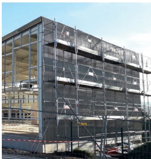
Collège Mathilde-Faucher à Allasac

USSEL – Remplacement des fenêtres de l'internat + clôture et portails (phase 2)