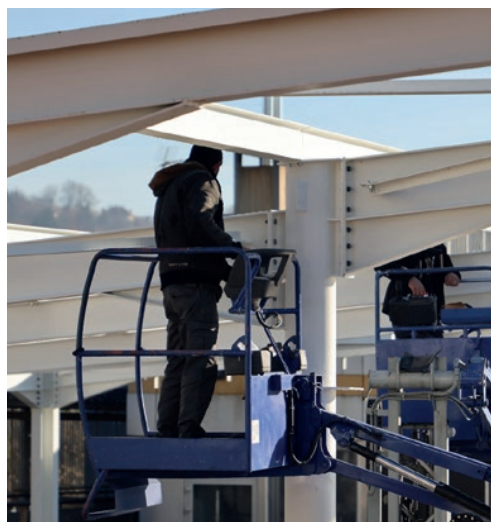
Collège Léon-Dautrement à Meyssac