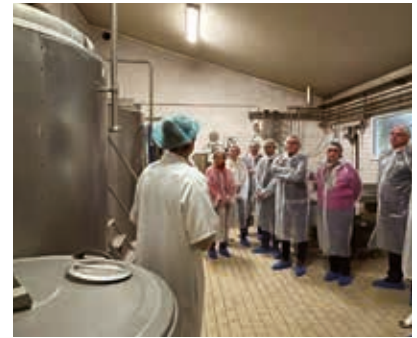
Promotion des circuits courts : visite de la Fromagerie Varsoise, labellisée Origine Corrèze (action prioritaire n°5)