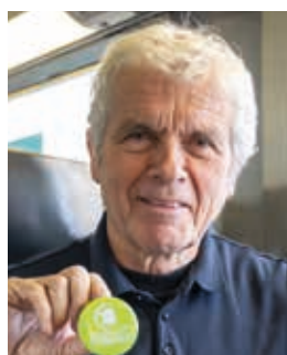
▲ Claude Sérillon Journaliste et auteur

"J'aime la Corrèze pour sa nature, me promener dans les bois, la gastronomie, la générosité... Cela m'inspire le bonheur, le fait de passer de bons moments comme je les aime ! Le label Origine Corrèze est intéressant, il devrait même exister dans toutes les régions ! Derrière un chef, il y a toujours un producteur, un travail. Vous avez des produits du terroir et le respect du terroir qui est ancré ; ce sont vos racines. Donc bravo pour ce label, il faut défendre un peu son Histoire, son identité ! "