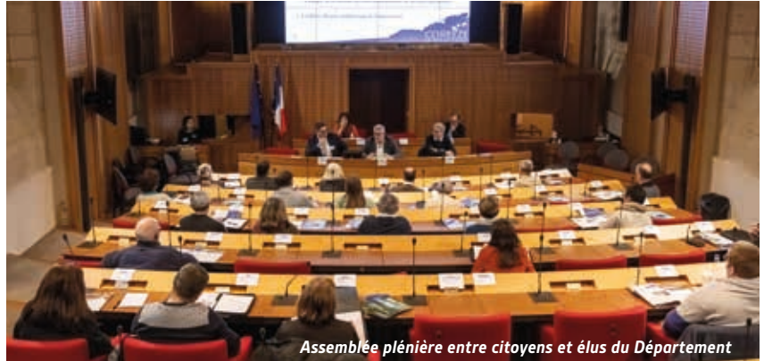
Assemblée plénière entre citoyens et élus du Département

En avril 2024, les 38 Corrèziens de l'Assemblée Citoyenne passeront le relais à d'autres volontaires. Visites de terrain, réunions de travail avec des experts, propositions de solutions, sessions plénières avec les élus... : durant deux ans, ils ont pris part aux projets majeurs de la collectivité pour l'avenir de la Corrèze et de ses habitants, aux côtés des Conseillers départementaux.