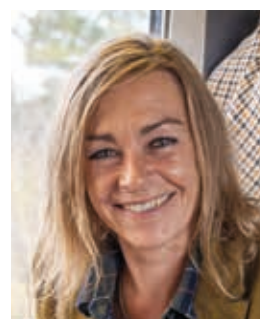
▲ Agnès Martin-Lugand Romancière

"J'apprécie la chaleur humaine des habitants de la Corrèze que j'ai l'occasion de rencontrer quand je viens, et l'accueil est toujours exceptionnel ! "