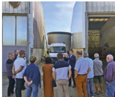
Gestion responsable des ressources : cuve de récupération d'eau de 75 m 3 au Centre des Routes de Chameyrat (action prioritaire n°1)