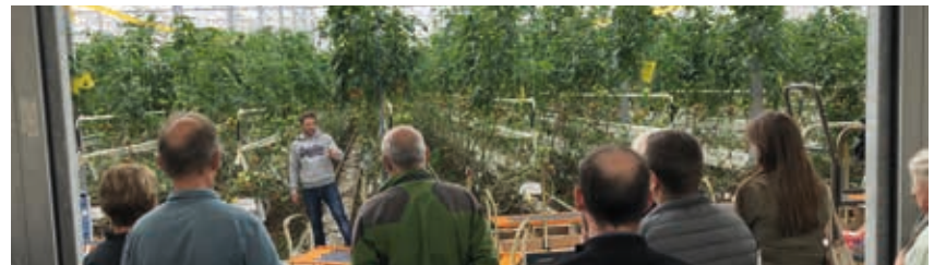
Optimisation de l'énergie à l'Unité de Valorisation Énergétique d'Egletons (action prioritaire n°3)