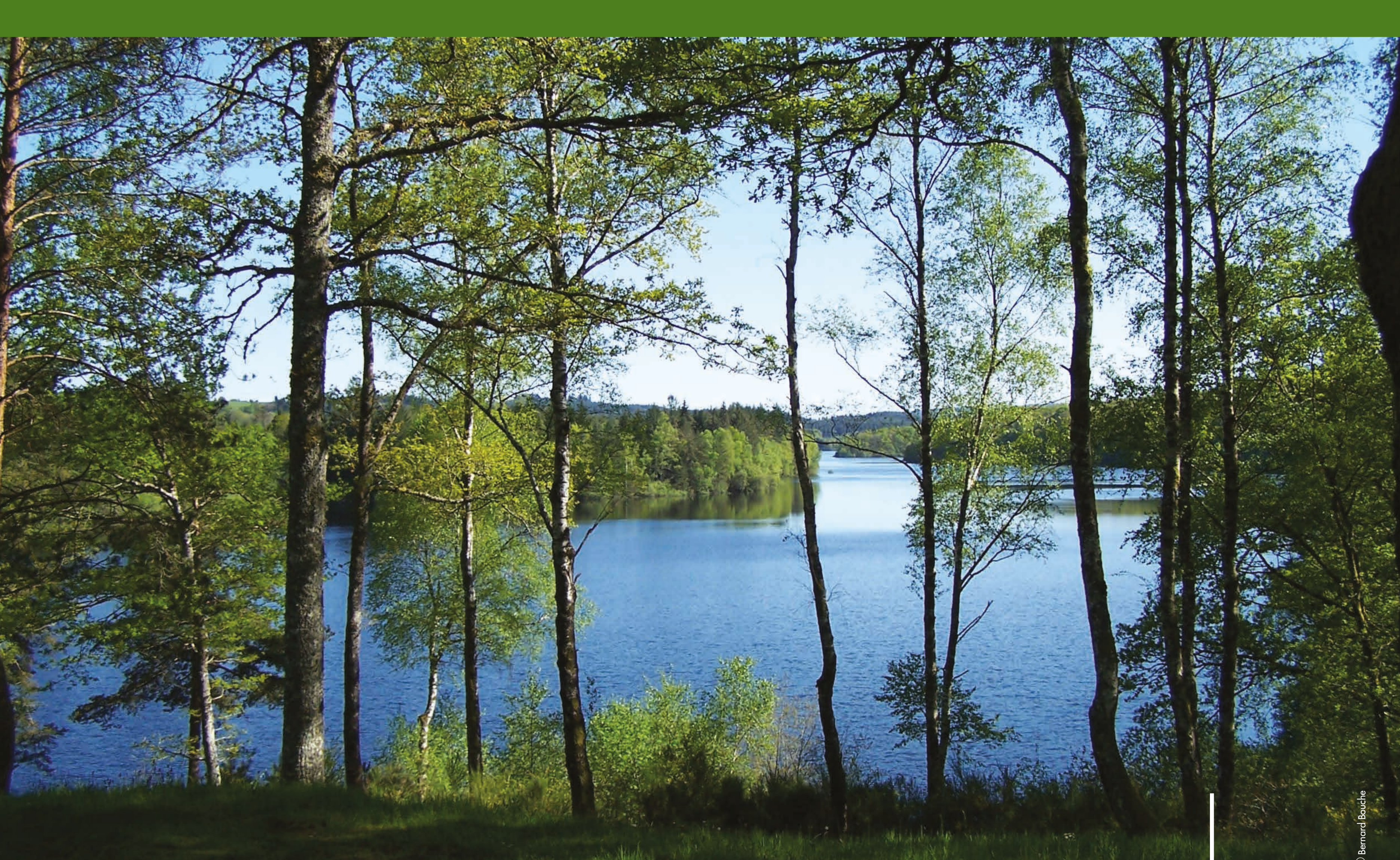
Lac de Viam