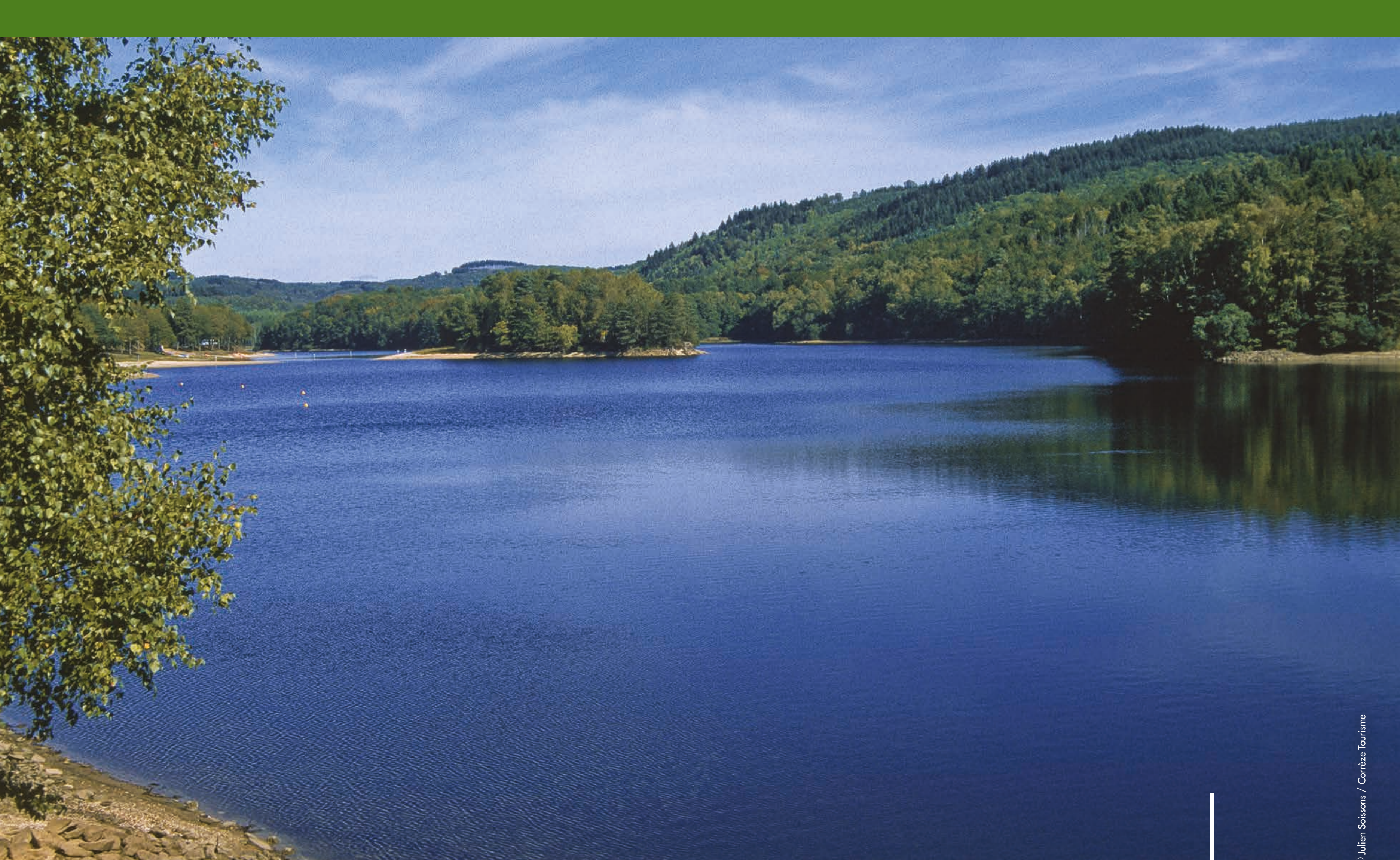
Lac des Bariousses